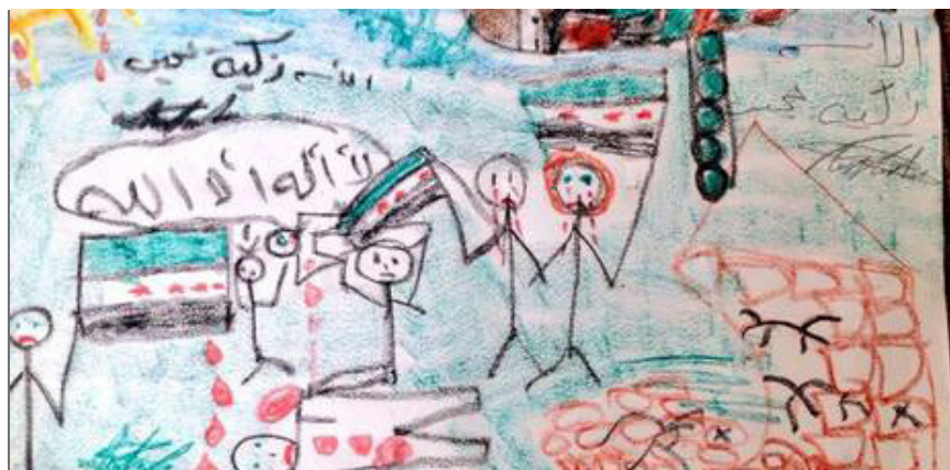
Dibujo de un niño sirio de 7 años que refleja la realidad en la que vive.

LO ÚLTIMO: Finalmente Estados Unidos y Rusia tuvieron un primer diálogo para intentar lograr una solución común que frene el avance del EI y ponga fin a la guerra civil, mediante una salida negociada con Al-Assad.